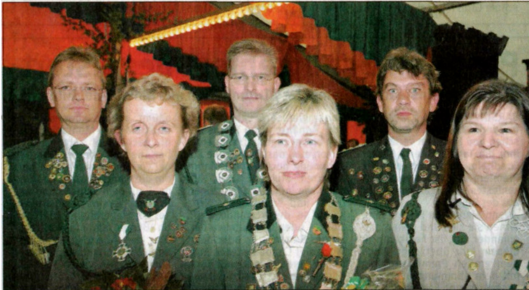
Strahlend präsentieren sich die neuen Kreiskönige bzw. Würdenträger des Kreisschützenverbandes Deister-Leine.